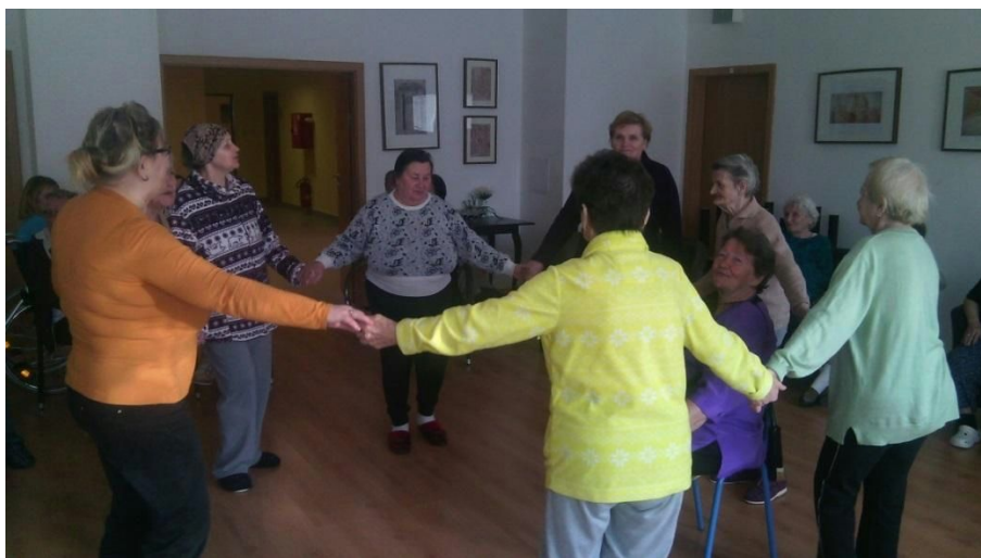
Obr.č. 4 „Posedenie pri heligónke“