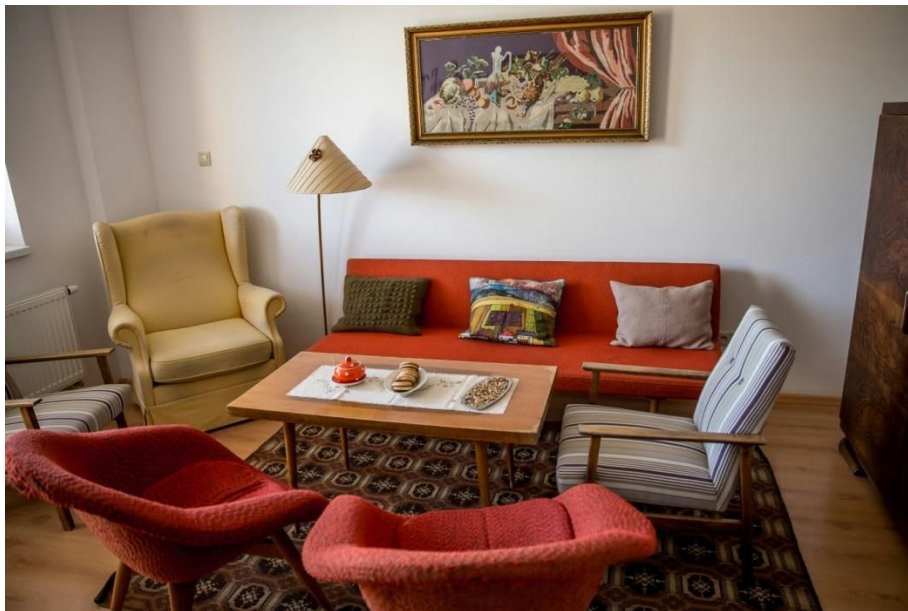
Obr.č. 10 reminiscenčná obývačka