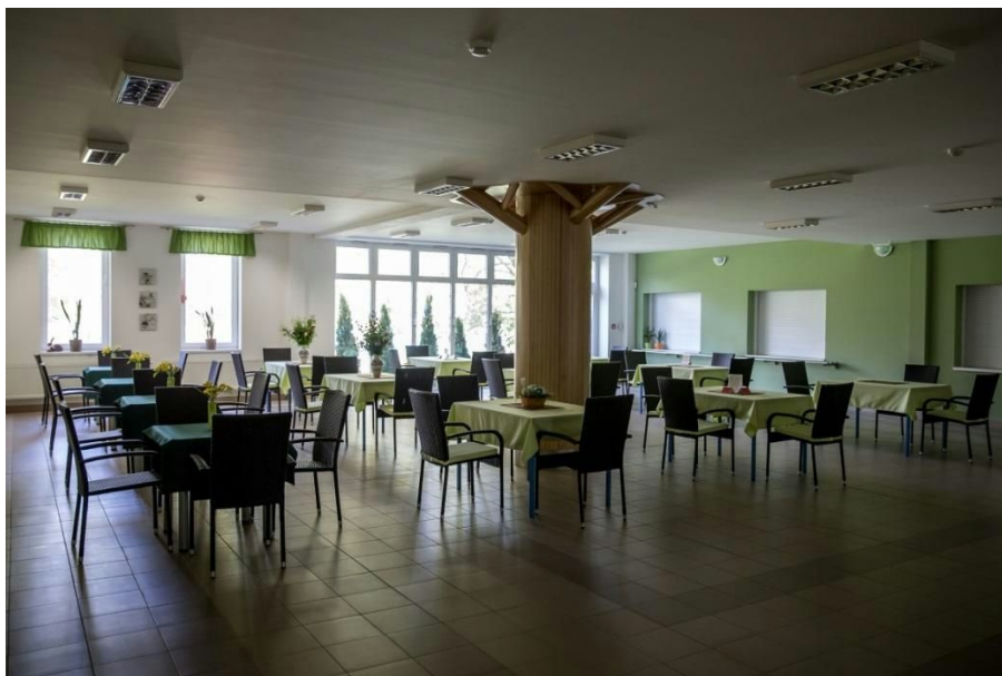
obr. č.1 jedáleň