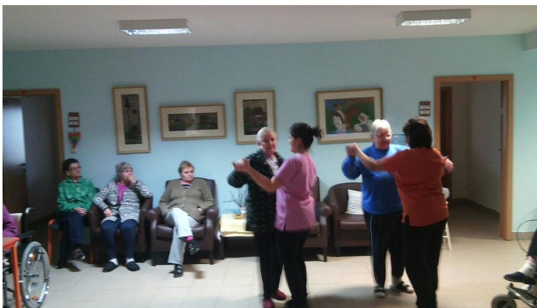
Obr.č.5 bezprostredný tanec s ošetrovateľským personálom