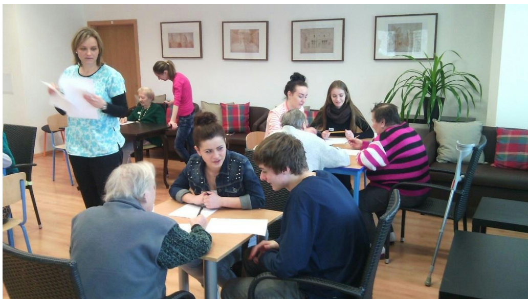
obr. č.3 „Týždeň mozgu 2014“