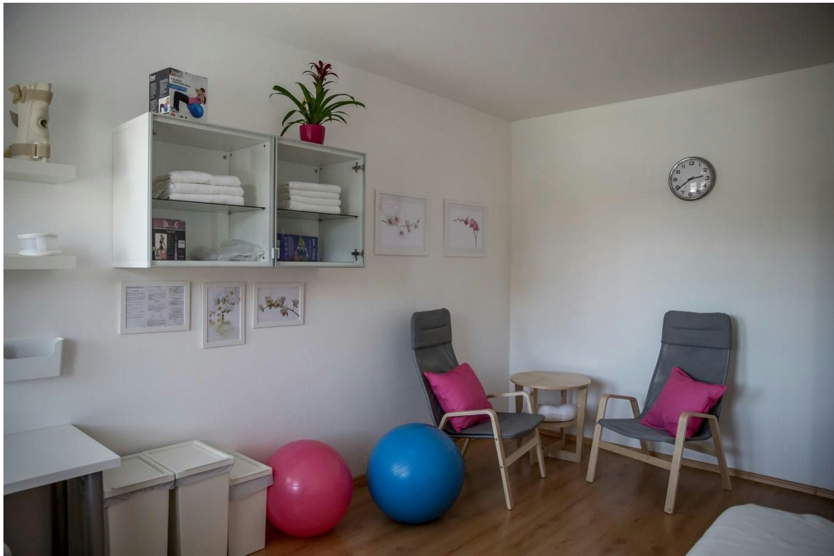
Obr. č.13 rehabilitačná miestnosť

Naše zariadenie poskytovalo v roku 2014 klientom aj možnosť rehabilitácie, ktorú zabezpečuje fyzioterapeut podľa ordinácie a pokynov odborného lekára.