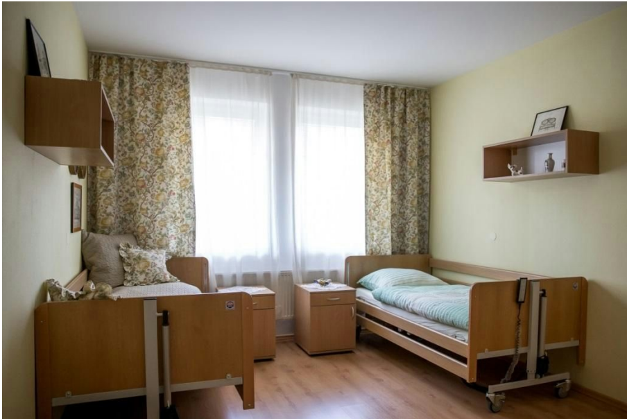
obr.č.2 dvojposteľová izba

klientov. Klienti boli ubytovaní na prízemí, 2. poschodí, 3. poschodí zariadenia. Vykurovanie a teplá voda je zabezpečovaná z vlastnej plynovej kotolne.