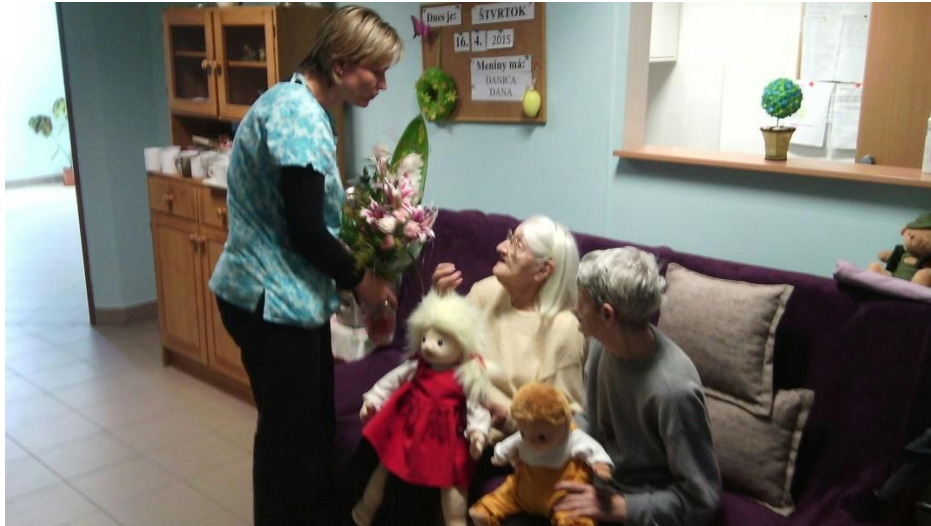
Obr.č. 8 praktické využitie terapeutických bábyky