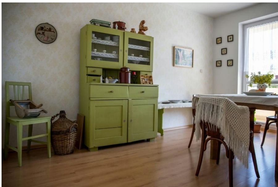
Obr.č.9 kopaničiarska kuchyňa