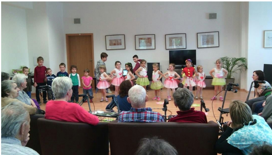
Obr.č.12 vystúpenie detí

Kultúrne vyžitie klientov sme zabezpečili návštevou koncertov žiakov ZUŠ, charitatívnych koncertov a príležitostných koncertov žiakov ZUŠ a základných škôl priamo v našom zariadení počas celého roku.